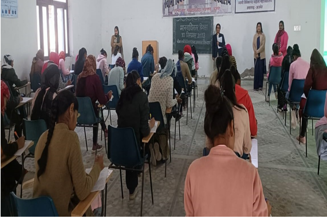
मानवाधिकार दिवस पर आयोजित निबन्ध प्रतियोगिता भाग लेते हुए प्रतिभागी