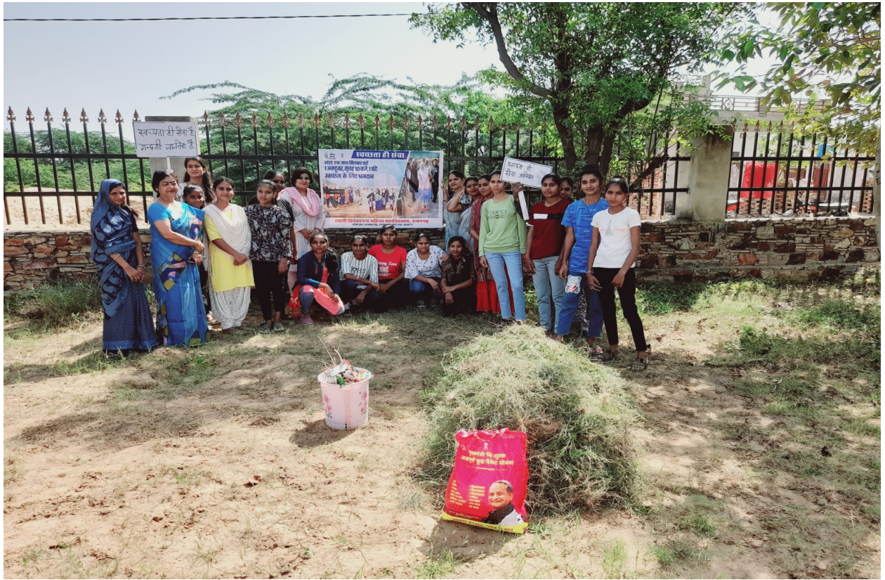
स्वच्छता जागरूकता रैली का आयोजन