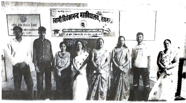
नसीराबाद। कार्यक्रम में मौजूद विद्यार्थी। -शैलेन्द्र गोयल